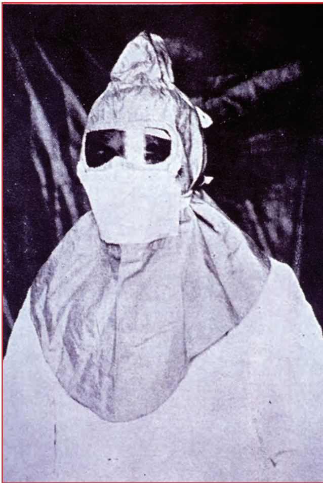
Fig. 4 - Masque de Broquet.