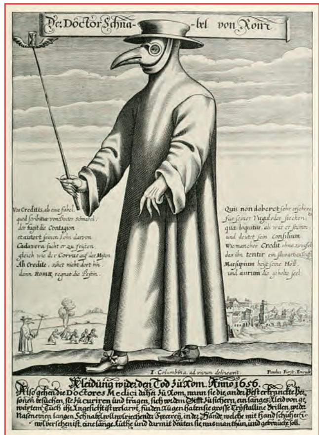
Fig. 1 - Doctor Schnabel : homme-oiseau, médecin de la peste. Médecin durant une épidémie de peste à Rome au XVII e siècle (gravure de Paul Fürst, 1656) : tunique recouvrant tout le corps, gants, bésicles de protection portées sur un masque en forme de bec, chapeau et baguette. Le surnom « Doctor Schnabel » signifie « Docteur bec ».

À la fin du XVII e siècle, on constate que certains artisans, comme les doreurs, les mineurs, les fabricants de chandelles ou encore les potiers, développent des pathologies que l'on peut rapporter à l'utilisation professionnelle de soufre, de chaux, de mercure, de limaille de fer ou encore de plomb. Bernardino Ramazzini (1633-1714), médecin à l'Université de Modène puis de Padoue, s'intéressa aux travailleurs exposés aux substances dangereuses, et est ainsi reconnu comme un pionnier de la médecine du travail