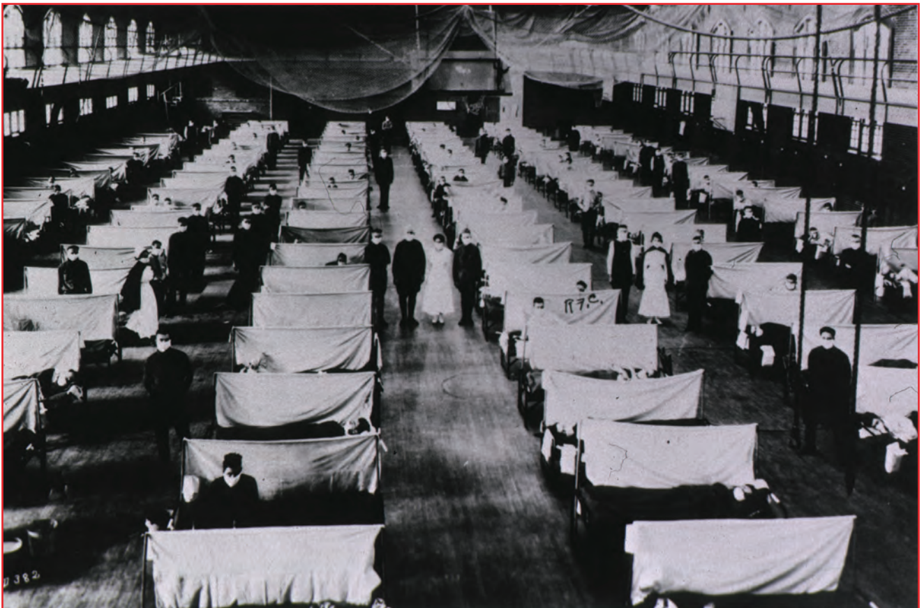
Fig. 7 - Malades isolés dans une unité de quarantaine lors de l'épidémie de grippe espagnole. Les lits des malades sont séparés par un rideau. Malades et personnels soignants portent un masque.