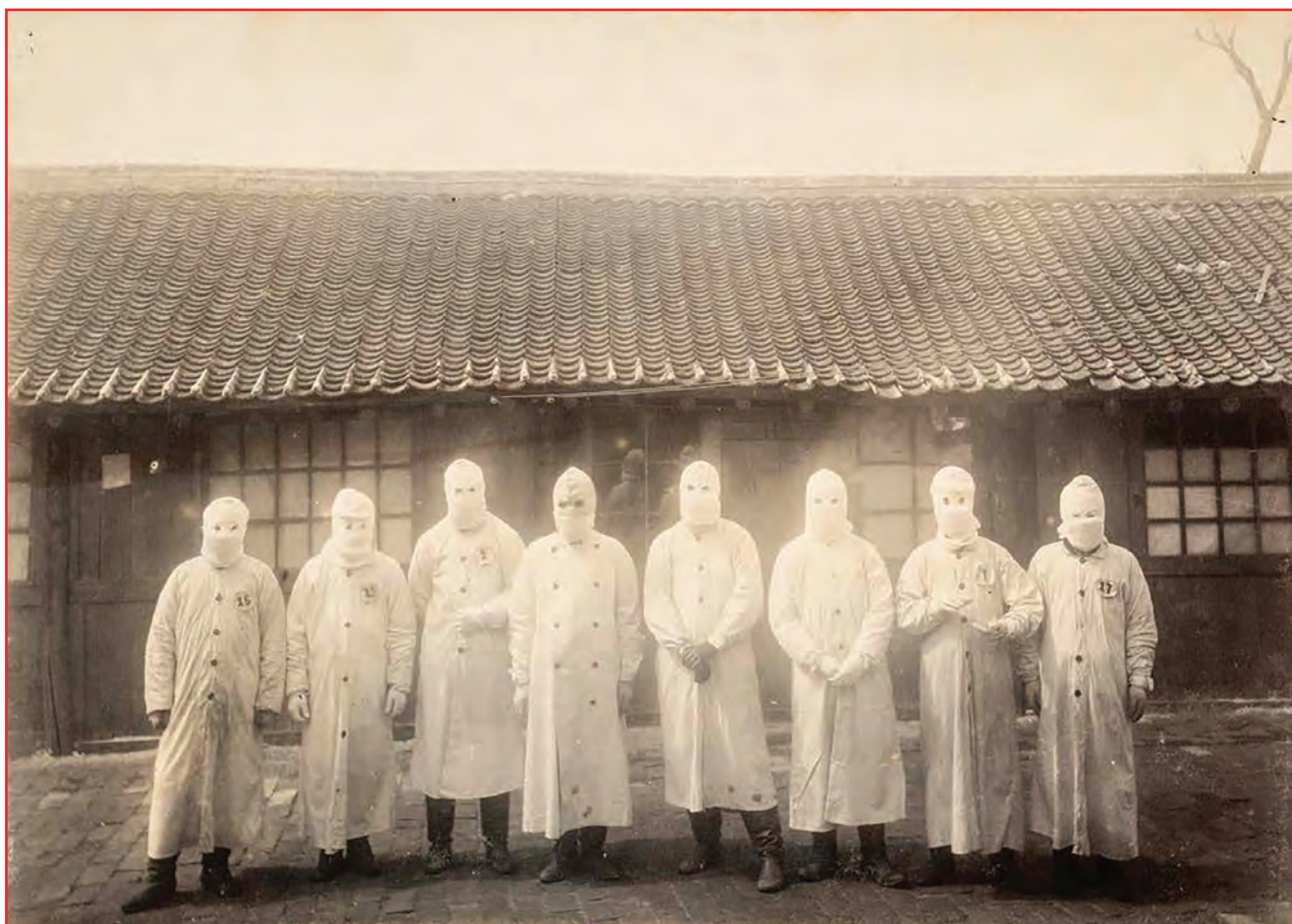
Fig. 3 - Médecins en Mandchourie pendant l'épidémie de peste de 1910, d'après (24).

Médecin des Troupes coloniales et sous-directeur de l'Institut Pasteur de Saïgon de 1908 à 1910, Charles Broquet (1876-1964) fut le délégué de la France à cette conférence. Il y présenta aussi son masque : « M'inspirant du dessin du costume de médecin quarantenaire de 1819, j'avais fait faire hâtivement, avant de partir de Paris, un masque d'une seule pièce, cagoule sur laquelle venait au niveau des yeux, s'appliquer une plaque de mica interchangeable, mais quand je voulus me servir de ce masque à Moukden, je trouvais qu'il gênait ma respiration... » (25) (Figure 4). Broquet modifia alors son masque pour le rendre plus pratique. Un filet remplaça la toile et il y inséra une couche de coton facilitant la respiration ; de plus, ce masque pouvait être stérilisé en le passant dans l'autoclave, dans de l'eau bouillante ou encore dans une solution antiseptique. Cependant, difficile à mettre en œuvre et à supporter, il fut rapidement abandonné. Remis à l'honneur lors de la Première Guerre mondiale par les armées françaises et britanniques, il sera néanmoins jugé inefficace.