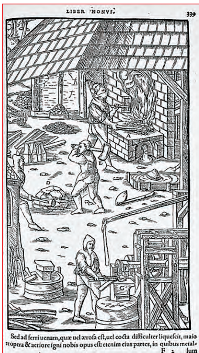
Fig. 2 - Protection des travailleurs des forges, d'après une illustration de l'ouvrage De Re metallica libri XII de Georgius Agricola.

Ce masque facial trouva un adepte avec le chirurgien Paul Berger (1845-1908) qui, redoutant les gouttelettes de Flügge, interdisait de parler en cours