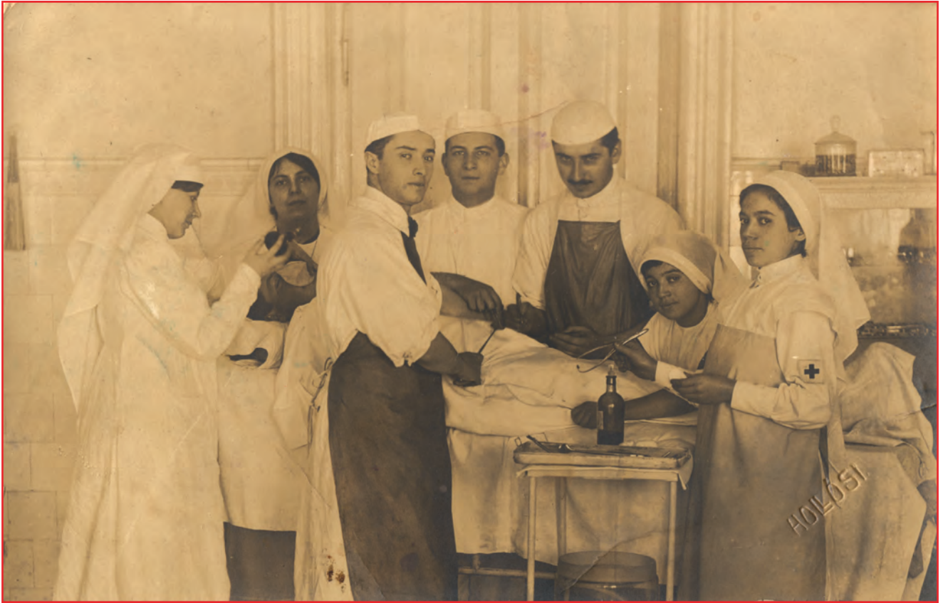
Fig. 6 - Une intervention chirurgicale en 1910 (Hongrie) sans le port d'un masque, tant par les médecins que les infirmières.